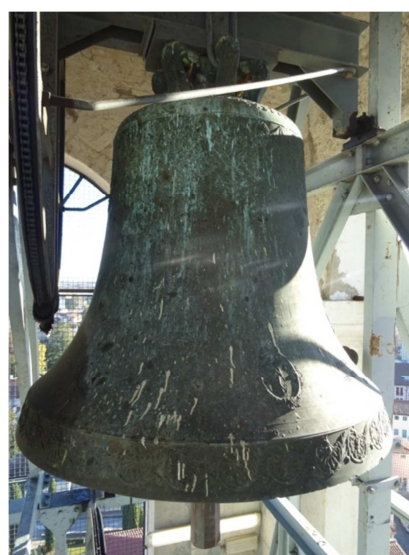
Campane del concerto piccolo. In ordine da sinistra: piccola, mezzana e grande