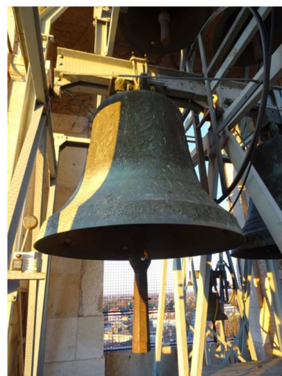
Campane del concerto grande. In ordine da sinistra: piccola, mezzana e grande